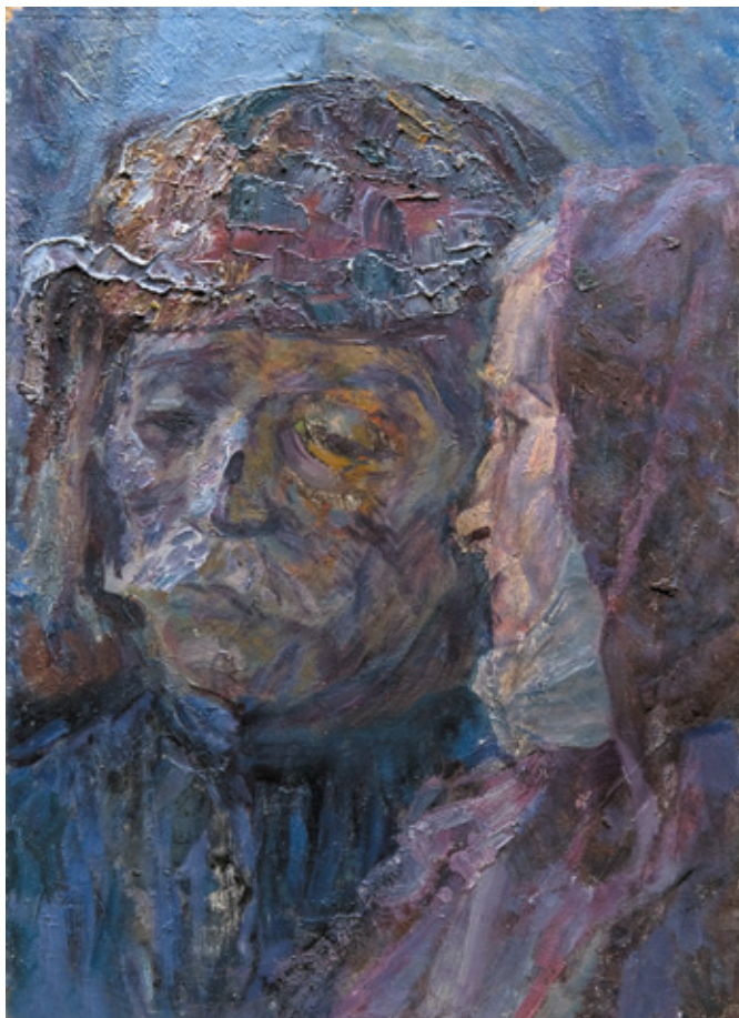
68 НОЕ НЕСТЕРОВИЧ ГЕДЕНИДЗЕ (1914–2002) РАЗГОВОРО ПРОШЛОМ. 1970 Картон, масло. 37x50

NOE NESTEROVICH GEDENIDZE (1914–2002) A CONVERSATION ABOUT THE PAST. 1970 Oil on cardboard. 37x50