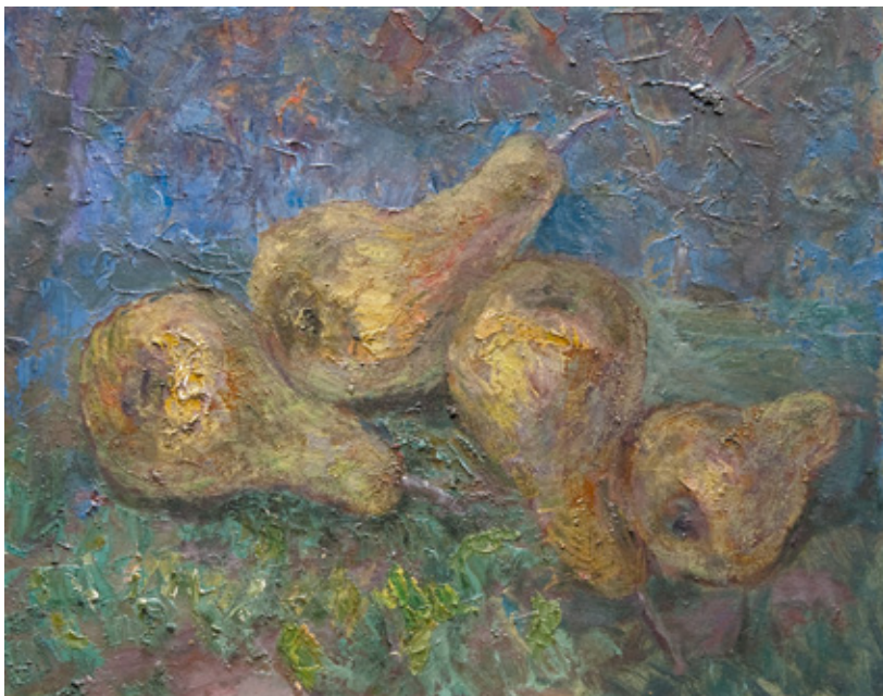
67 НОЕ НЕСТЕРОВИЧ ГЕДЕНИДЗЕ (1914–2002) ГРУШИ. 1972 Картон, масло. 40x50

NOE NESTEROVICH GEDENIDZE (1914–2002) PEARS. 1972 Oil on cardboard. 40x50