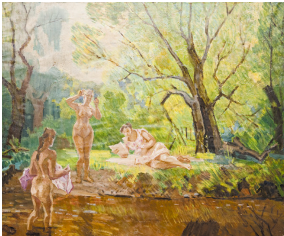
77 НИКОЛАЙ НИКОЛАЕВИЧ ГОРЛОВ (1917–1988) КУПАНИЕ В ЛЕСУ. 1985 Холст, масло. 100x120

NIKOLAY NIKOLAEVICH GORLOV (1917–1988) BATHING IN THE FOREST. 1985 Oil on canvas. 100x120