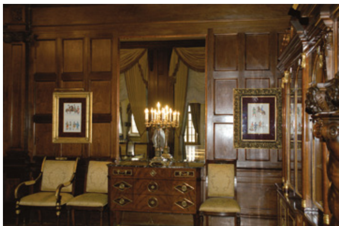
Спасо-хаус принимает Галерею Леонида Шишкина. Москва. 2009. Резиденция посла США в России.