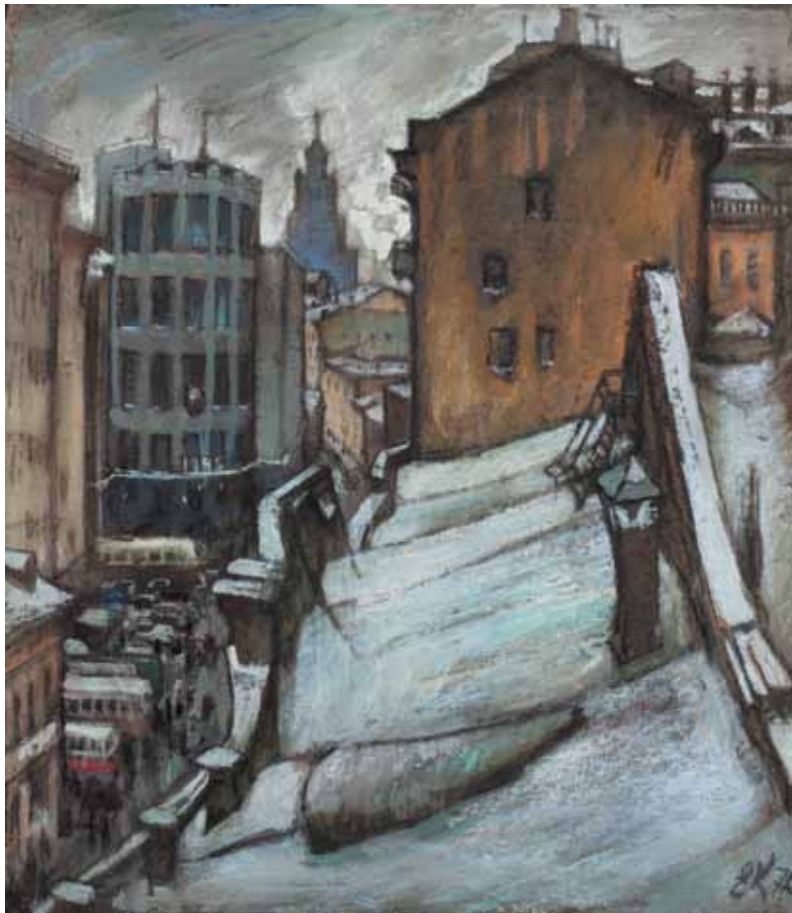
36 ЕВГЕНИЙ ИВАНОВИЧ КУМАНЬКОВ (1920–2012) ДЕКАБРЬ. 1976 Картон, пастель. 72x63 Инициалы и дата «ЕК 75» справа внизу Происхождение: из коллекции писателя Юрия Нагибина

EVGENY IVANOVICH KUMANKOV (1920–2012) DECEMBER. 1976 Pastel on cardboard. 72x63 Initials in Cyrillic and date lower right Provenance: from the collection of the writer Yury Nagibin