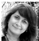
Арт-директор: Екатерина Батогова Art Director: Yekaterina Batogova