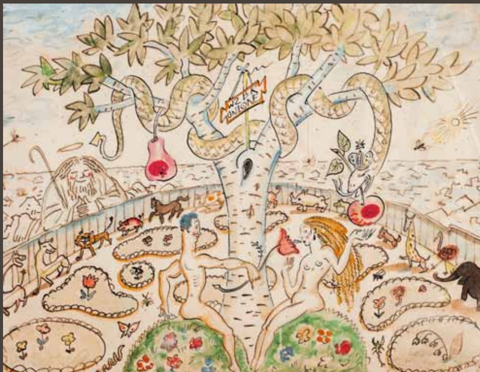
25 Мстислав Валерьевич Добужинский (1875–1957) ЭДЕМСКИЙ САД Бумага, смешанная техника. 23,5х31 в свету Происхождение: аукцион Christie's, 29 ноября 2007, лот 1193

MSTISLAV VALERIEVICH DOBUZHINSKY (1875–1957) THE GARDEN OF EDEN Mixed medium on paper. 23.5x31 (without margins) Provenance: Christie's Auction, 29th of November 2007, lot 1193